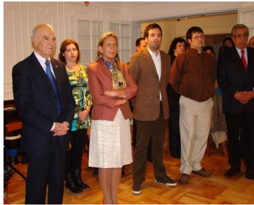
Cocktail de Inauguración. Casa de los Intendentes.