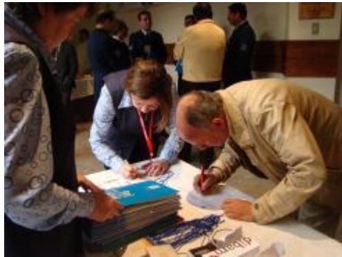
Acreditación. Salón Auditorium MOP.

IMÁGENES DEL SEGUNDO ENCUENTRO DE MUSEOS DE PATAGONIA SUR_SUR CHILE-ARGENTINA 2012 6, 7 y 8 de NOVIEMBRE, PUNTA ARENAS