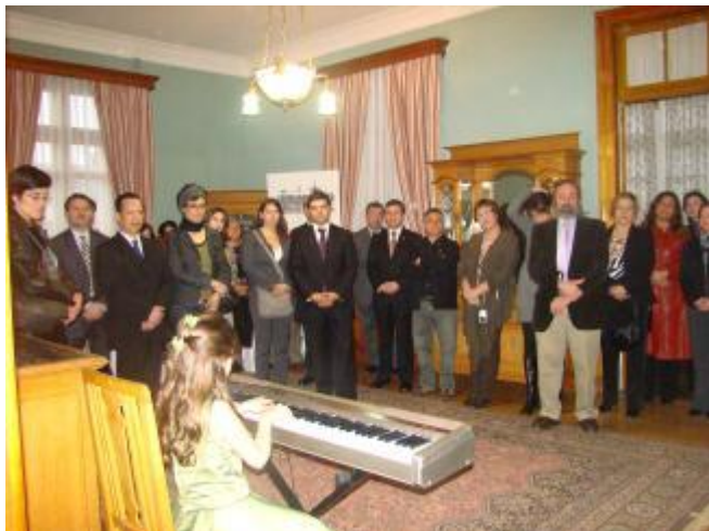
Cocktail de Clausura, Consulado Argentino. Concierto de Piano, Alumna Conservatorio de Música.