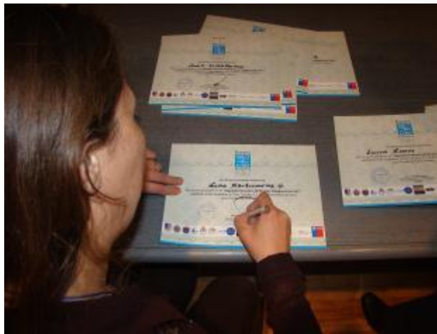
Acreditación de Cierre; emisión de certificados.