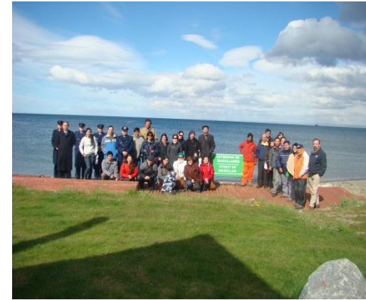
Visita a Museo de Sitio Nao Victoria.