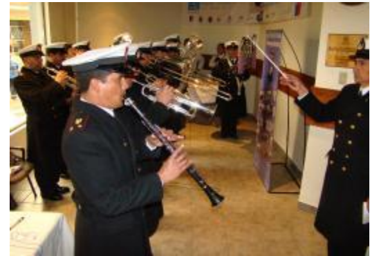
Banda Naval. Ceremonia de Inauguración