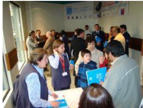
Acreditación. Salón Auditorium MOP.