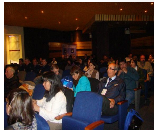
Público asistente, Día 08 de Noviembre.