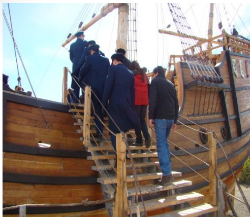
Visita a Museo de Sitio Nao Victoria.