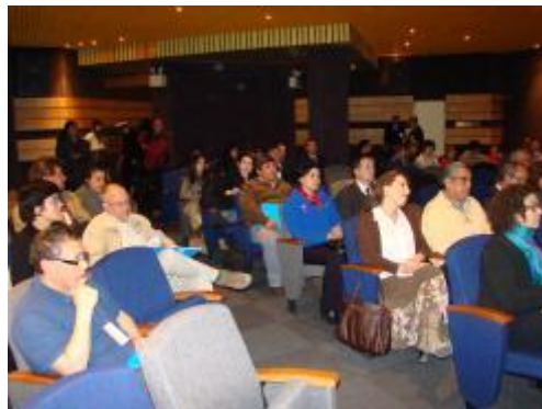
Ceremonia de Inauguración.