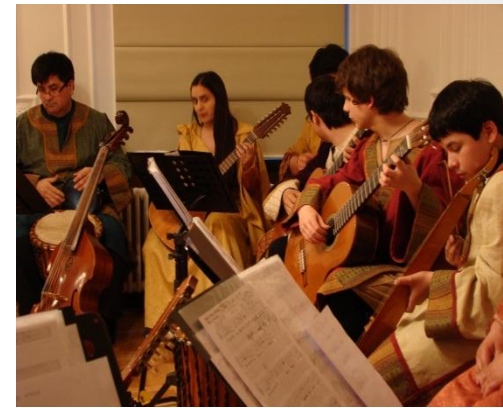
Cocktail de Inauguración. Conjunto Música Antigua Casa Azul del Arte.