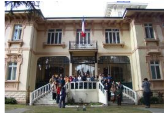
Visita a Monumentos Históricos de Punta Arenas.