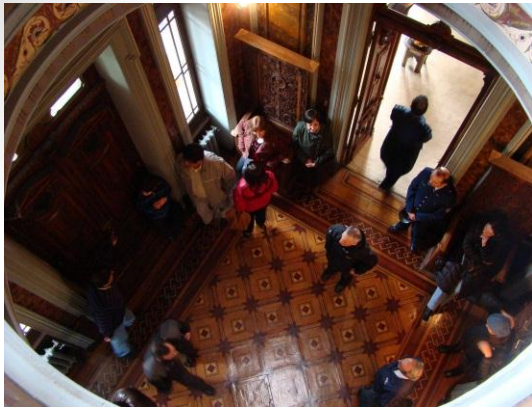
Visita a Monumentos Históricos de Punta Arenas. Palacio Sara Braun.