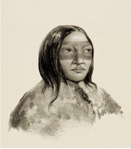
Figura 11. Goupil, E. y Le Breton, L. «Mujer patagónica». Lámina n° 14 del tomo primero del atlas ilustrado de la expedición (1846). Museo Regional de Magallanes.

La reacción de los patagones no es de extrañar, pues —como se expuso anteriormente— ellos creían en la existencia de espíritus malignos capaces de ocasionar daño a las personas, el que intentaban contrarrestar incorporando a su vida espiritual, «Como todas las sociedades primitivas, [...] un conjunto de prohibiciones cuyos fines decían [relación] con el sano ordenamiento familiar, con la salud, y la tranquilidad individual y colectiva» (Martinic, 1995, p.160). Los tabúes se referían a muchas situaciones y objetos, a los cuales se atribuía la causalidad de la mala suerte: una de ellas era «la reproducción de la figura humana mediante el dibujo o