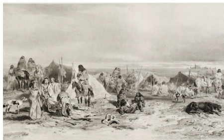
Figura 9. Le Breton, L. «Campamento de patagones en puerto Peckett». Lámina n° 12 del tomo primero del atlas ilustrado de la expedición (1846). Museo Regional de Magallanes.

En su crónica, d'Urville los describe, efectivamente, como individuos de gran tamaño, mas sin alcanzar las dimensiones exageradas que reportaban los mitos sobre los gigantes patagones. Según las observaciones del comandante, tenían una estatura promedio de entre 1,73 y 1,76 m, y estaban dotados de espaldas anchas y una estructura bien constituida y proporcionada, salvo por sus extremidades algo débiles.