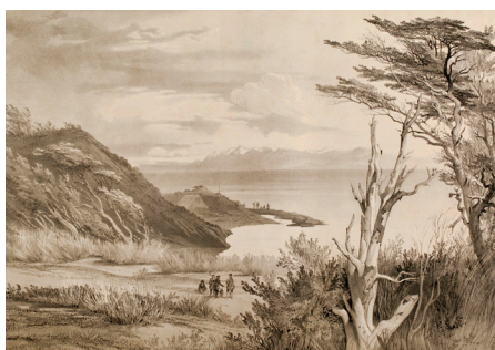
Figura 8. Goupil, E. «Vista de los alrededores de Puerto del Hambre». Lámina n° 2 del tomo primero del atlas ilustrado de la expedición (1846). Museo Regional de Magallanes.

río San Juan, donde pudieron observar el bosque circundante compuesto en su mayoría por ejemplares de haya antártica ( Nothofagus antarctica ) y, en menor medida, por árboles de corteza de Winter ( Wintera aromatica ) y una clase de berberís (fig. 7). De todas las labores que llevó adelante la misión durante la primera visita a este sector del estrecho, la más fructífera fue, precisamente, la de los naturalistas, porque pudieron recolectar y documentar un sinnúmero de especies botánicas completamente desconocidas hasta entonces por los museos de Francia.