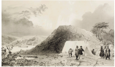
Figura 5. Le Breton, L. «Vista del observatorio establecido en puerto del Hambre». Lámina n° 3 del tomo primero del atlas ilustrado de la expedición (1846). Museo Regional de Magallanes.