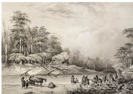
Figura 7. Le Breton, L. «Entrada a los bosques del río Sedge». Lámina n° 6 del tomo primero del atlas ilustrado de la expedición (1846). Museo Regional de Magallanes.