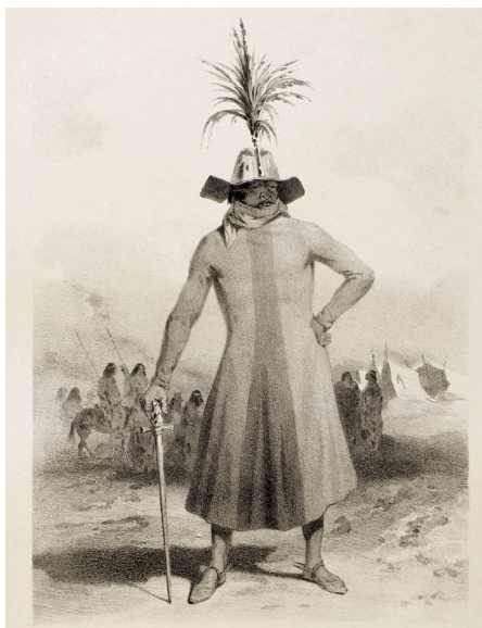
Figura 10. Goupil, E. y Le Breton, L. «Jefe patagón en traje de guerra». Lámina n° 14 del tomo primero del atlas ilustrado de la expedición (1846). Museo Regional de Magallanes.

Ellos son supersticiosos; las mujeres sobre todo creen en los sortilegios y en el poder de que les hagan el mal. Tanto a los hombres como a las mujeres, los hemos encontrado muy mal dispuestos a dejarse dibujar: hemos podido captar sus rasgos sólo a hurtadillas y un poco al azar. [...] [He escuchado] pronunciar delante mío varias veces la palabra demonio cuando he hecho el ademán de dibujar a uno de ellos, he concluido que, tal vez, conocían brujos y un poder oculto, como casi todos los pueblos salvajes. (D'Urville, 2011, p. 160).