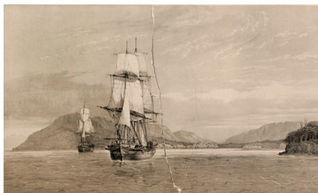
Figura 3. Le Breton, L. «Anclaje de las corbetas en la bahía San Nicolás». Lámina n° 9 del tomo primero del atlas ilustrado de la expedición (1846). Museo Regional de Magallanes.

prevista para zarpar desde el puerto de Tolón el 1.º de septiembre de 1837, con rumbo al mar de Wedell, en el océano Antártico —en la práctica, sin embargo, el viaje se inició con seis días de retraso—. Luego de la exploración del Polo Sur, se contemplaba una visita al estrecho de Magallanes, para posteriormente