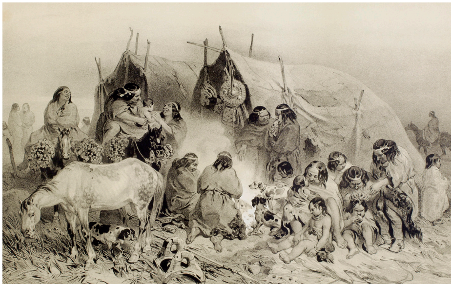
Figura 12. Bayot. «Grupos de patagones en puerto Peckett». Lámina n° 15 del tomo primero del atlas ilustrado de la expedición (1846). Museo Regional de Magallanes.

especie de choza cubierta con pieles muy bien cosidas y otras superpuestas de manera circular. En total, instalaron una veintena de toldos, que ordenaron en dos filas.