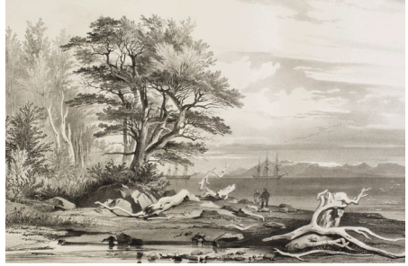
Figura 4. Goupil, E. «Puerto del Hambre». Lámina n° 4 del tomo primero del atlas ilustrado de la expedición (1846). Museo Regional de Magallanes.

Aquí instalaron la carpa donde montaron los instrumentos necesarios para las diversas tareas «de la física, de la meteorología, de las mareas, de la historia natural, etc.» (D'Urville, 2011, p. 73) que procurarían ejecutar (fig. 5). Durante la estadía en este sector calcularon ángulos horarios, realizaron el trazado de las costas y elaboraron los planos del puerto donde Pedro Sarmiento de Gamboa habría fundado en 1584 el fuerte Rey Don Felipe, primer asentamiento español en la Patagonia (fig. 6). Además, exploraron los alrededores del río Sedger, conocido actualmente como