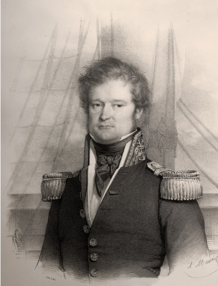
Figura 1. Maurin, A. El comandante de la expedición de la Astrolabe , Jules Sébastien César Dumont d'Urville, 1839. Atlas historique du voyage de l'Astrolabe (1883). Biblioteca Nacional de Chile, n° sist. 68353.

En su ruta hacia el continente antártico, la misión se detuvo por varios días en el estrecho de Magallanes. Allí se aprovisionaron de agua y madera, hicieron mediciones, recolectaron muestras botánicas y sostuvieron un encuentro con aborígenes patagones –la hoy desaparecida etnia aónikenk– en las cercanías de puerto Peckett. Fueron cinco días de convivencia amistosa, durante los cuales los expedicionarios pudieron conocer el modo de vida, costumbres y cosmovisión de este pueblo, que había adquirido ribetes míticos desde su primer contacto con los europeos en el siglo XVI. El relato del periplo y los resultados de los trabajos científicos realizados quedaron registrados en la obra Viaje al Polo Sur y a Oceanía en las corbetas L'Astrolabe y La Zélée, ejecutado por orden del Rey durante los años 1837, 1838, 1839 y 1840, bajo el mando del señor J. Dumont d'Urville capitán de navío , publicada en París entre los años 1841 y 1856 (fig. 2).