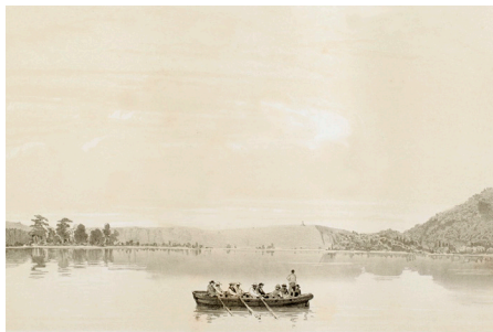
Figura 6. Le Breton, L. «Emplazamiento de la antigua colonia de la Ciudad del Rey Felipe». Lámina n° 5 del tomo primero del atlas ilustrado de la expedición (1846). Museo Regional de Magallanes.